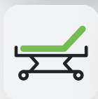
Rückenteil 0 – 70°