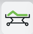
Fußteil 0 – 30°