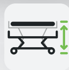
Höhe 250 – 800 mm

Dieses moderne Pflegebett bietet Komfort und Ergonomie zu wirtschaftlichen Konditionen und ist in vielen ansprechenden Dekoren erhältlich. Das Xenia Low eignet sich dadurch besonders als Einstiegsmodell für die stilvolle Einrichtung von Seniorenheimen.